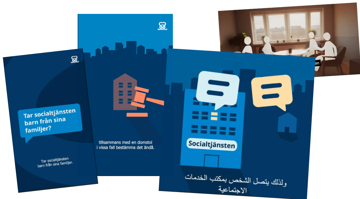
Socialstyrelsen har tagit fram animerade videor på flera olika språk som förklarar socialtjänstens arbete.

i sociala medier där de sprider filmer om hur socialtjänstens arbete fungerar och bemöter kommentarer i kommentarsfälten. De har också svarat på frågor som sprids i egna kampanjer, både på svenska och arabiska.