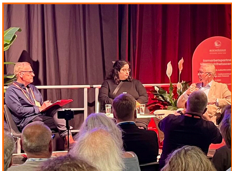
Seminariet "Att skydda sig mot desinformation" till vänster, scensamtalet "Påverkansoperationer" till höger.